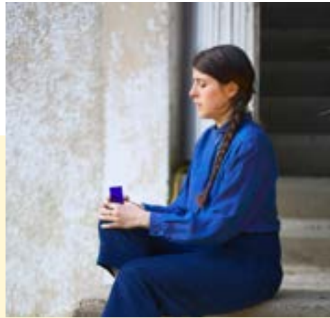
Élise Girardot