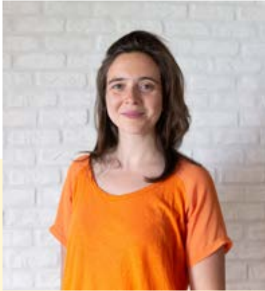
Andréanne Béguin