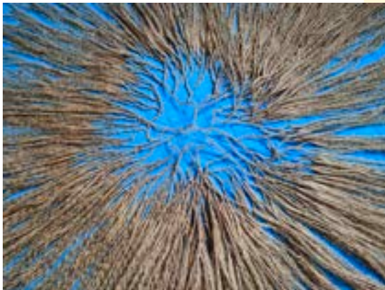
recherches, 2024 © Guillaume Barborini