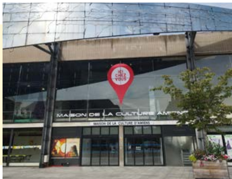
La Maison de la Culture d'Amiens