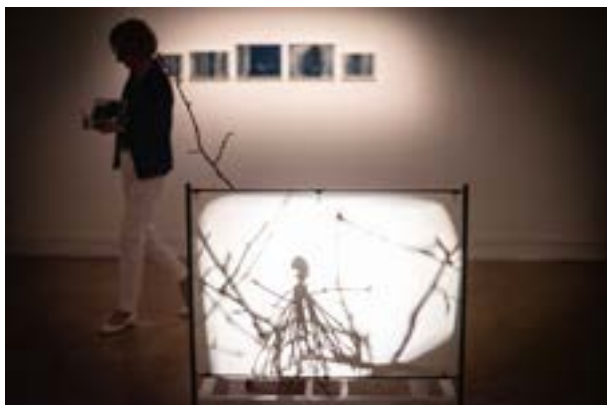
Exposition Une histoire de l'art , Philippe Dupuy