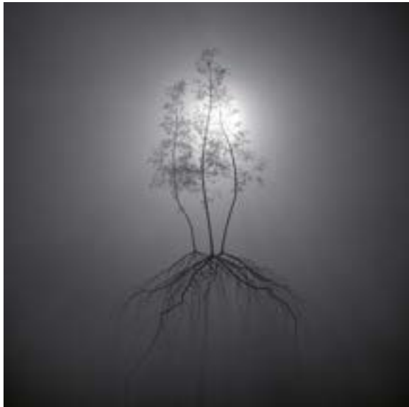
Éden - COLLECTIF MxM - Cyril Teste & Hugo Arcier