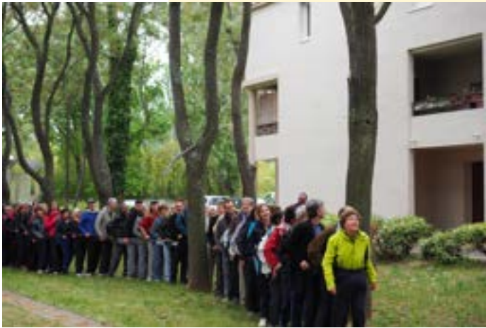
Pantalonnade, Chuglu, 2019 © Victor Aube-Martin