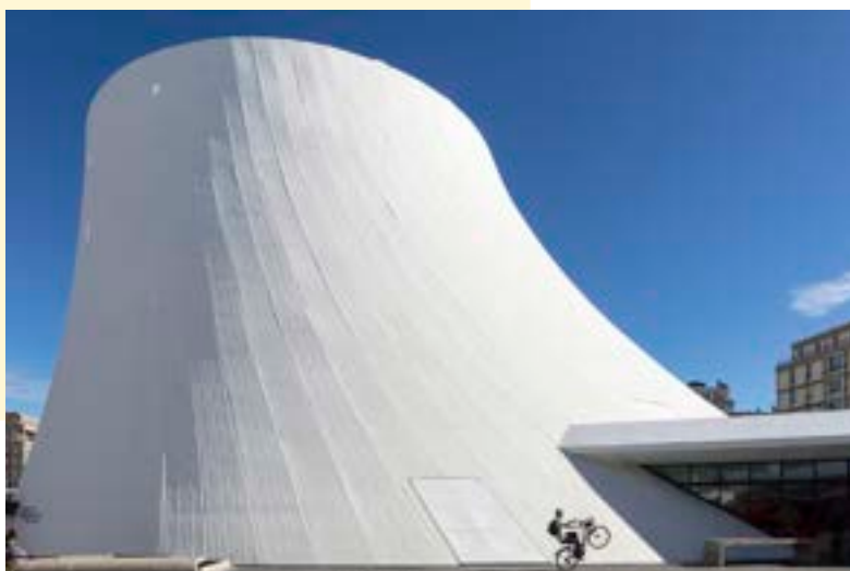
Le Volcan