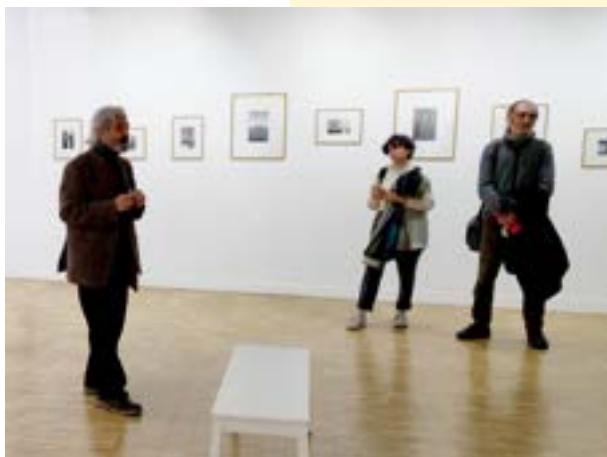
Bernard Plossu, exposition En Égypte le long du Fleuve