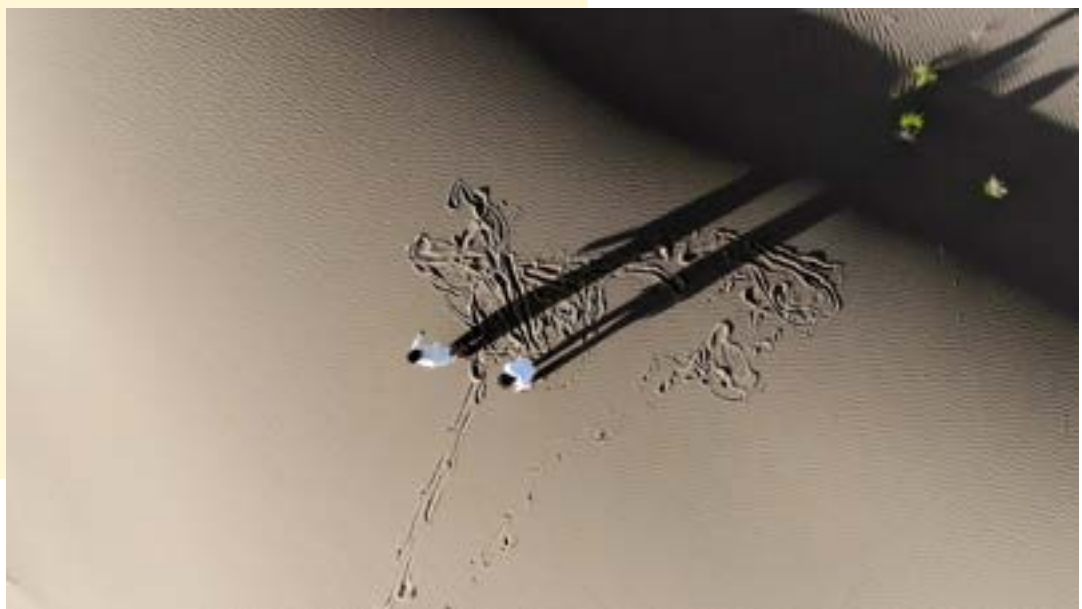
Liu Xin, The White Stone , 2021; Digital Video, 5.1 sound mix or stereo sound 21'57