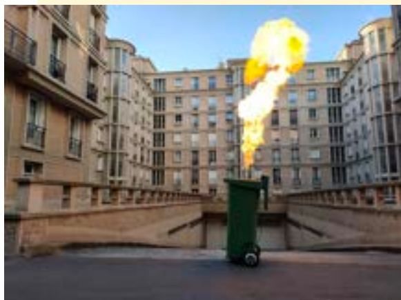
HeHe, image extraite de la vidéo Ballet de la poubelle (2024, 2'36)