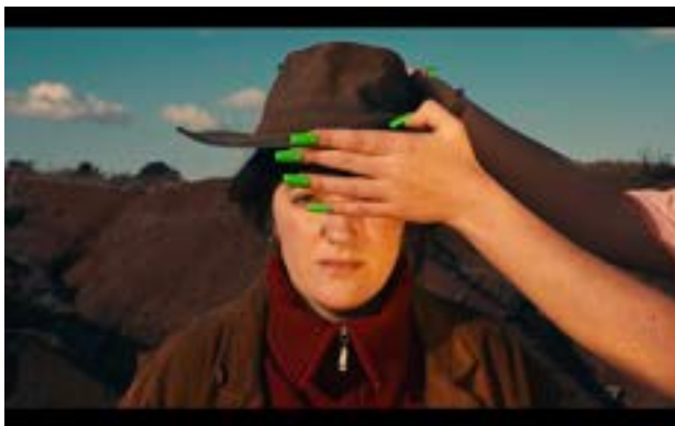
Carla Adra, Ça te colle à la peau , 2023, Vidéo HD, Courtesy Galerie Valeria Cetraro