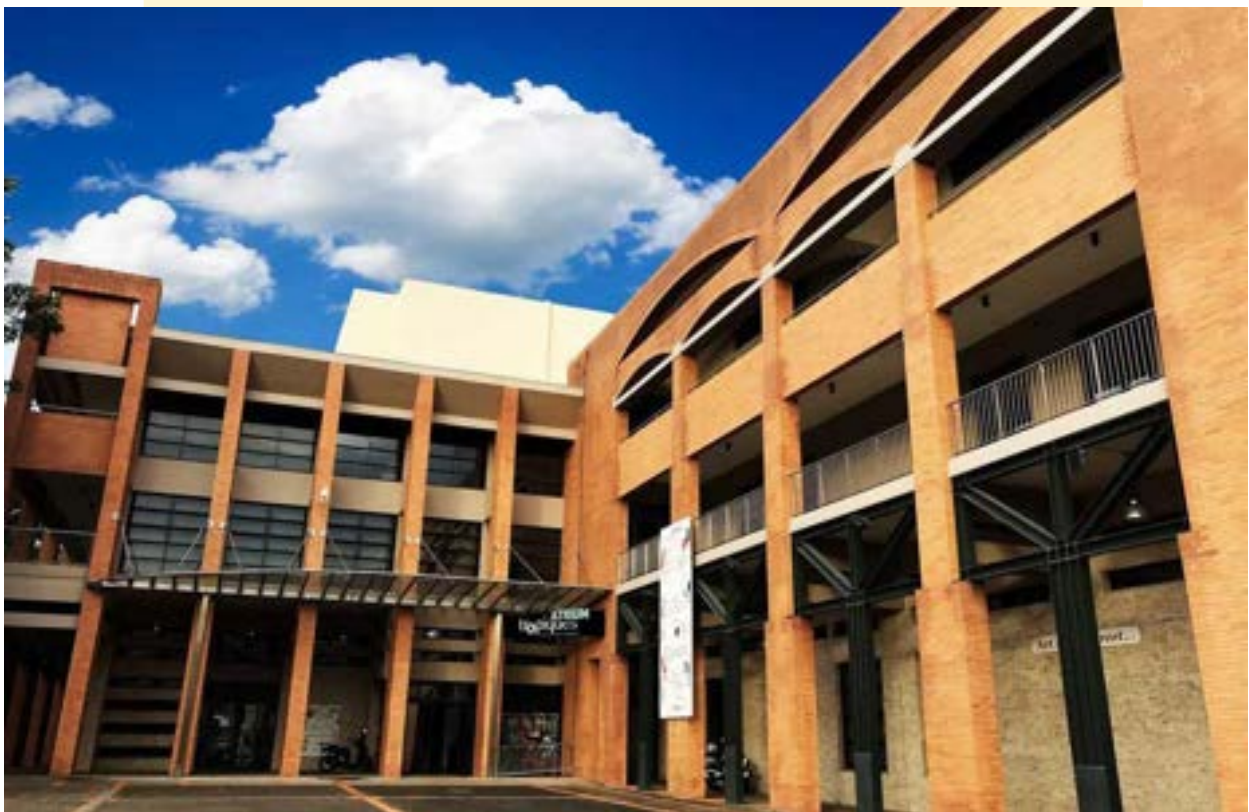
Tropiques Atrium Scène Nationale