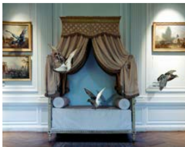
Karen Knorr, The Green Bedroom Louis XVI , Musée Carnavalet, 2005