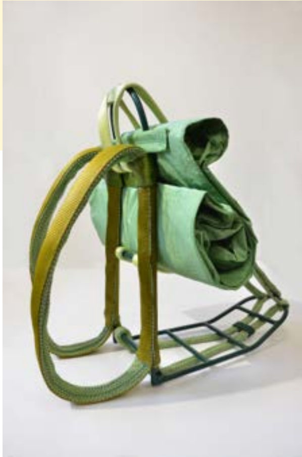
Awena Cozannet, Force Motrice, 2022 © ADAGP