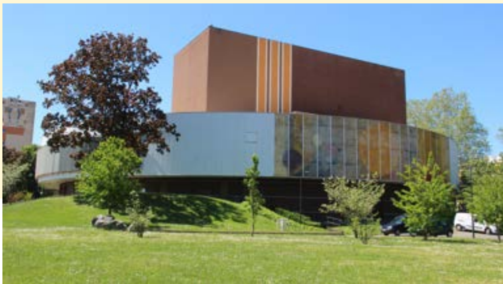
Le Théâtre - Mâcon