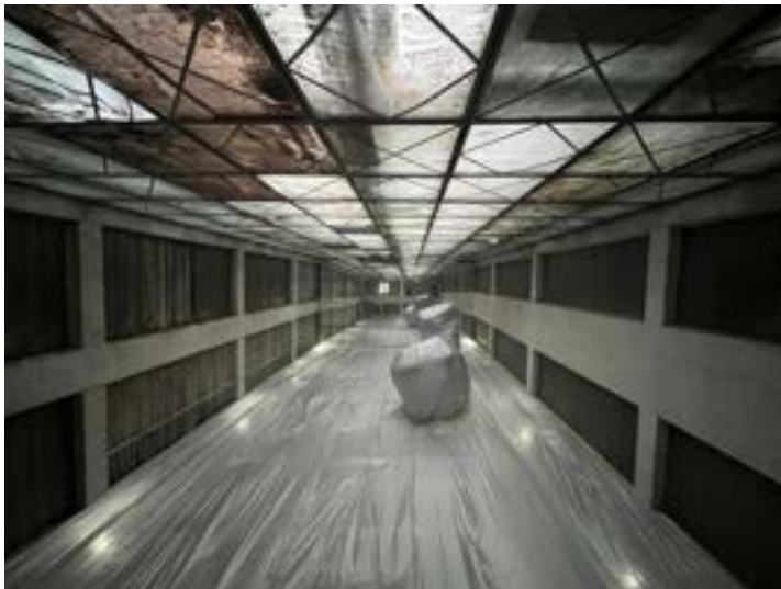
L'intérieur du Palais de la Culture de la ville de Toretsk, Ukraine.