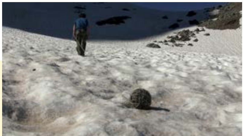
Portée de nos pas, 2021 © Guillaume Barborini