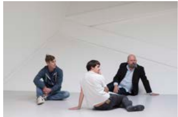
Carole Douillard, The Waiting Room , Performance Frac MécA, 2023, Courtesy Carole Douillard & ADAGP © Jean-Christophe Garcia