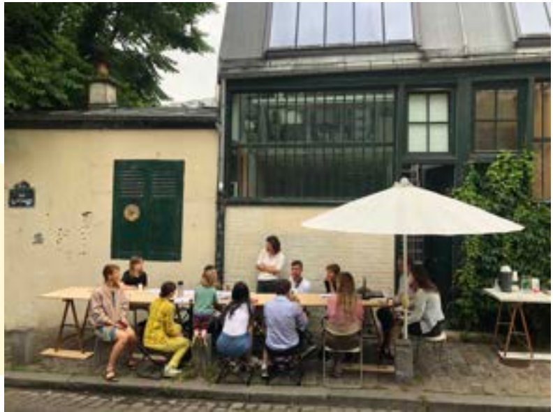
Le collectif Beyond the post-soviet (Btps)