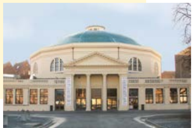
Hippodrome de Douai